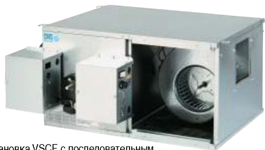
Установка VSCF с последовательным питанием вентиляторов