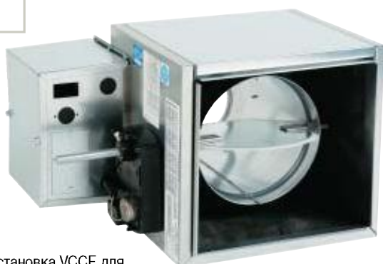
Установка VCCF для одноканальной системы