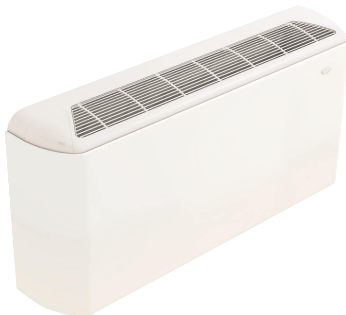
Рис. 6. Вертикальный фэн-койл MFU